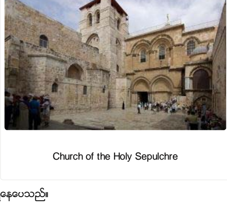
Church of the Holy Sepulchre

နှစ်ပေါင်း ၂၀၀ ခန့် နောက်ပိုင်းတွင် ရောမဘုရင် ကွန်စတင်တင် တင်း က ခရစ်ယာန်ဘာသာကို ရောမအင်ပါယာ၏ နိုင်ငံတော်ဘာသာ အဖြစ် သတ်မှတ်ပြီး ယေရုရှလင်တွင် ဘုရားကျောင်း များကို ဆောက်သည်။ အေဒီ ၃၃၅ တွင် Church of the Holy Sepulchre ကို သခင်ယေရူ အသတ်ခံရသော နေရာ နှင့် မြှုပ်နှံ ခဲ့သည့် ဗု နေရာ တပိုက်တွင် တည်ဆောက် ခဲ့သည်။ ထိုနေရာ၌ ပင် Emperor Hadrian က ထိုနှစ် မတိုင်ခင်လွန်ခဲ့သော နှစ် ၁၀၀ ခန့်တွင် ဗီးနပ်စ် နတ်ဘုရားကျောင်း တည်ခဲ့သည့် memory ယေရူခရစ်တော် နှင့် ပတ်သက်သော ယုံကြည်မှု memory အားလုံး ပျောက်ကွယ်သွားရန် ရည်ရွယ်ချက်ဖြင့် တည်ခဲ့သည် ဟု ဆိုသည်။ ဗီးနပ်စ် နတ်ဘုရားကျောင်း အစား Church of the Holy Sepulchre သည် ယနေ့ထိတိုင်အောင် မားမားမတ်မတ် ဤနေရာတွင် တည်ရှိနေပေသည်။